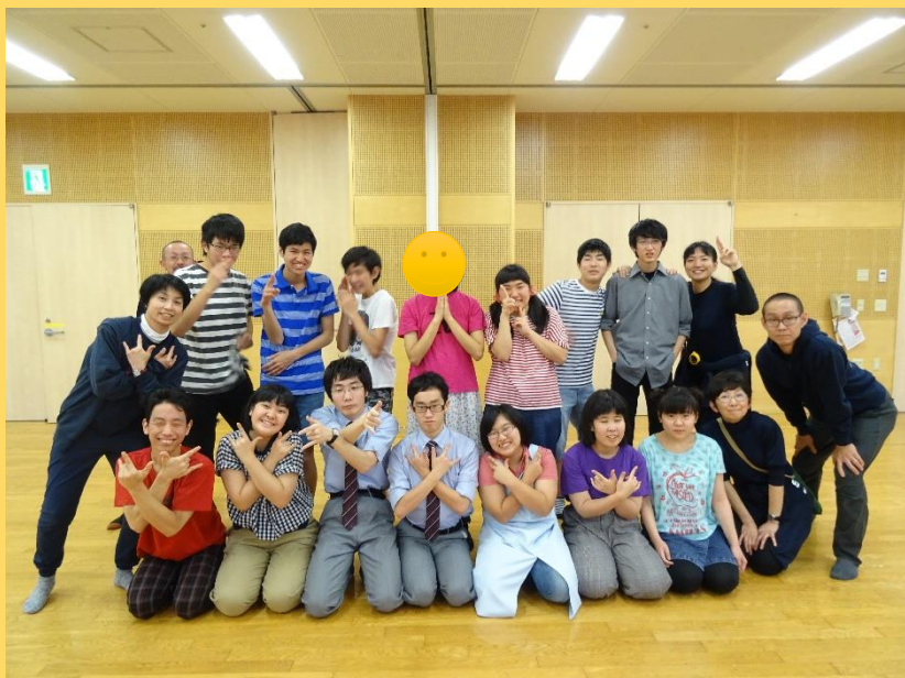
上演後の集合写真。見てください！充実感、達成感いっぱいの顔！！