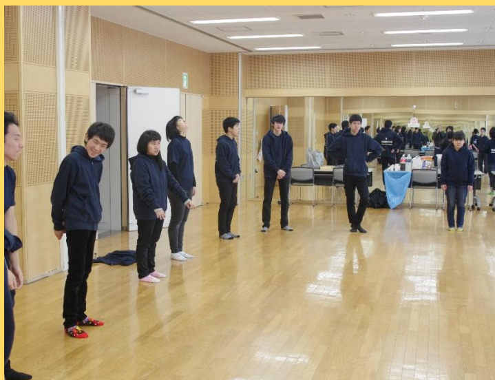
上演前、リハ室にて。しっかりと体を動かして、発声練習。

11月25日(日)障がい者の文化芸術活動を普及させることを目的に昨年から開催されているアール・ブリュット ショーケース in 岩見沢から招致を受け、「よだかの夢」を上演させていただきました。全道大会の翌週ということもあり、疲れもピークでしたが、ご来場いただいた皆様に精一杯の「よだかの夢」をお届けすることができました。特にアフタートークでは今までに知らなかった部員達の一面を見ることができ、とても充実した時間を過ごすことができました。